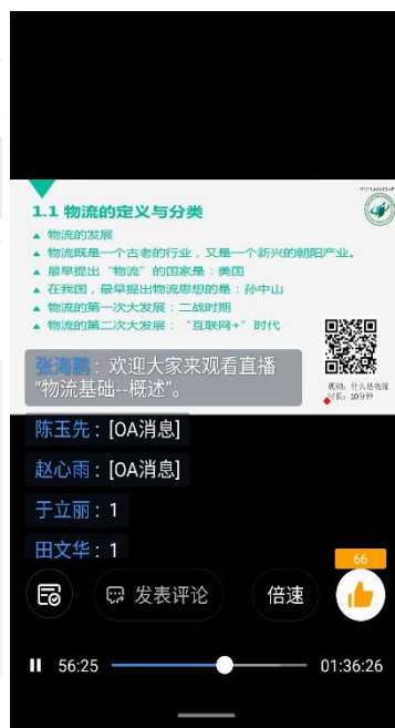
图 3 钉钉数据