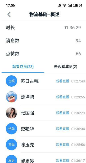
图 4 视频回放