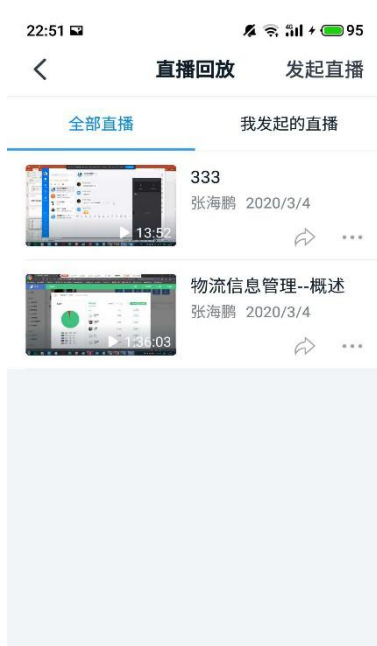
图 5 教学过程